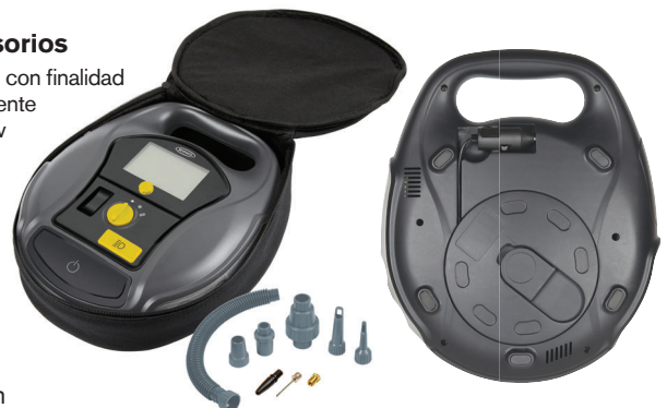
Imagen con finalidad meramente ilustrativa